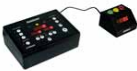
Sprekersklok Spreekijd-indicator in minuten en seconden.