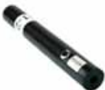
Laserpointer Groot, in rood.